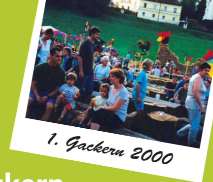
1. Gackern 2000